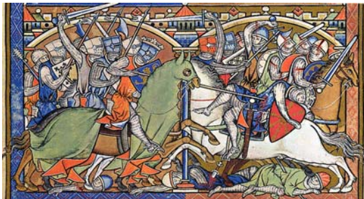
Bibbia Maciejowski XIII sec.

Le attività saranno suddivise fra settore civile (arti e mestieri) e settore militare (accampamenti, duelli, scrima)